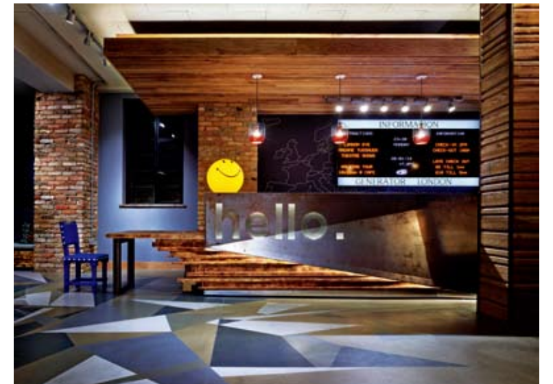
View of reception desk