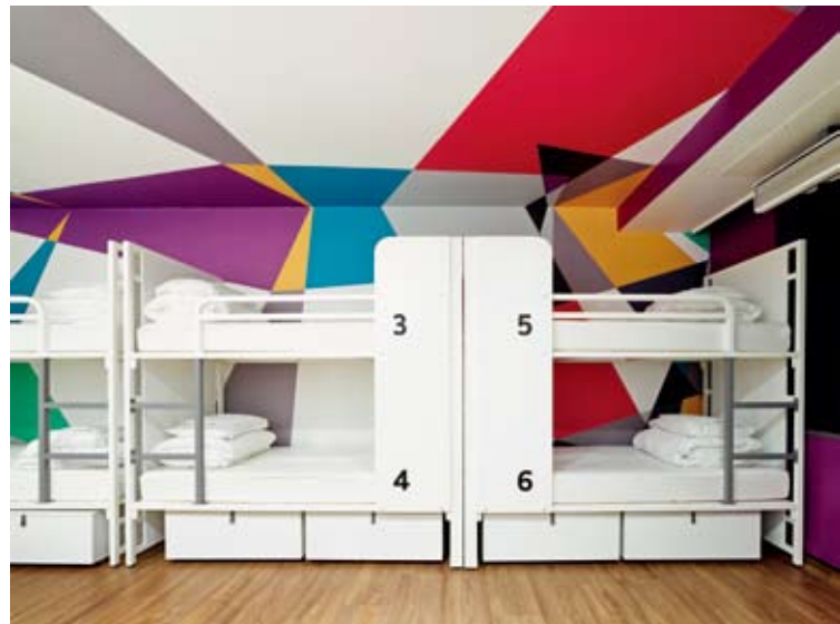
Boldly colored camouflage graphics wrap the walls and ceiling in the dorm rooms