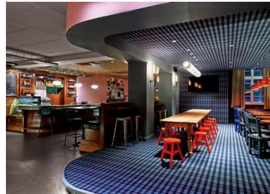
Eclectic zones in the all day cafe create diverse areas