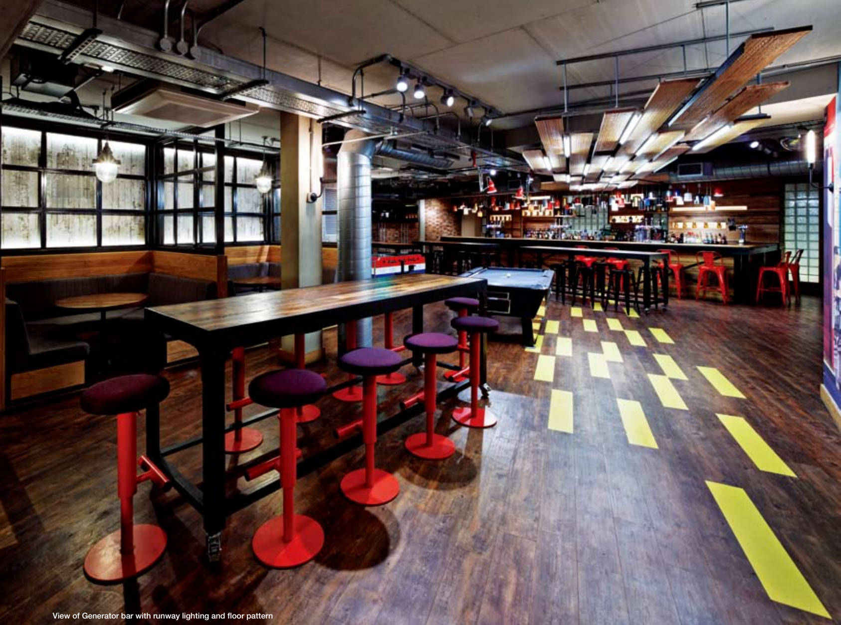
View of Generator bar with runway lighting and floor pattern