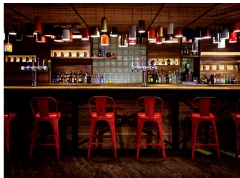
Recycled fire extinguisher lights and bar tank lights set the mood for drinking

새롭게 단장한 <제너레이터 런던>은 최근 성장하고 있는 도심 호텔 체인사업의 대표 지점으로서 제너레이터 특유의 에너지 넘치는 모습과 극명한 현대적 디자인 요소들로 꾸며졌다. 건물은 기존에 경찰서가 자리하던 러셀 스퀘어에 위치해 있으며, 호텔 내부에는 이러한 위치적 특성을 반영하여 런던의 복잡한 거리가 전해주는 역동적인 모습을 나타내도록 디자인됐다. 새로운 디자인 콘셉트는 대담한 그래픽, 풍성한 패턴, 그리고 영국의 문화적인 아이콘을 통해 <제너레이터 런던>의 다양하고 친숙한 공간 속에 런던 거리의 역동성과 역사의 즐거움, 문화 및 스타일 등을 뒤섞어 함께 전달한다. 전체적인 디자인은 공간, 경험, 스타일이 겹겹이 쌓여 완성됐으며, 이곳은 여행객들이 서로 어울리거나 휴식을 취하고, 파티를 열어 즐거운 시간을 보내면서 마치 자신의 집처럼 편안함을 느낄 수 있는 분위기로 꾸며졌다.