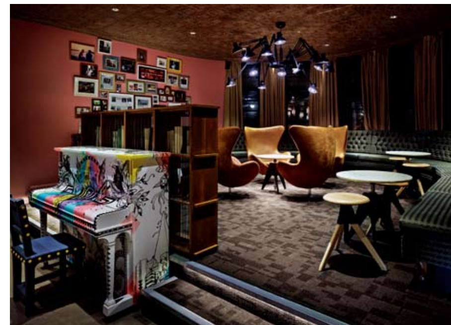
The furnishing in lounge adds a contemporary twist to the traditional British pub aesthetic