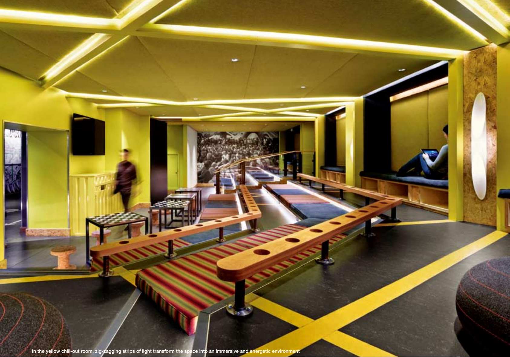
In the yellow chill-out room, zig-zagging strips of light transform the space into an immersive and energetic environment