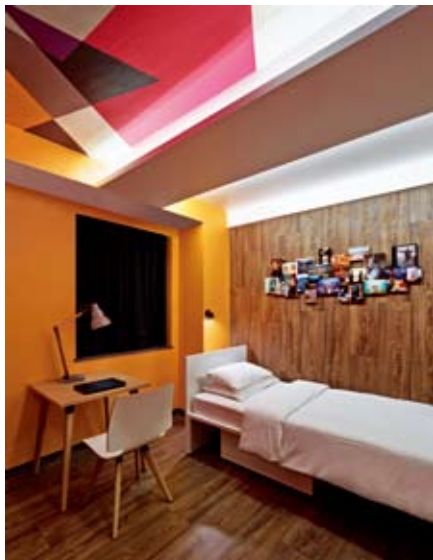
'Generator Premium' room with single beds