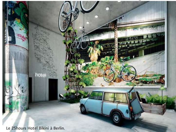
Le 25hours Hotel Bikini à Berlin.