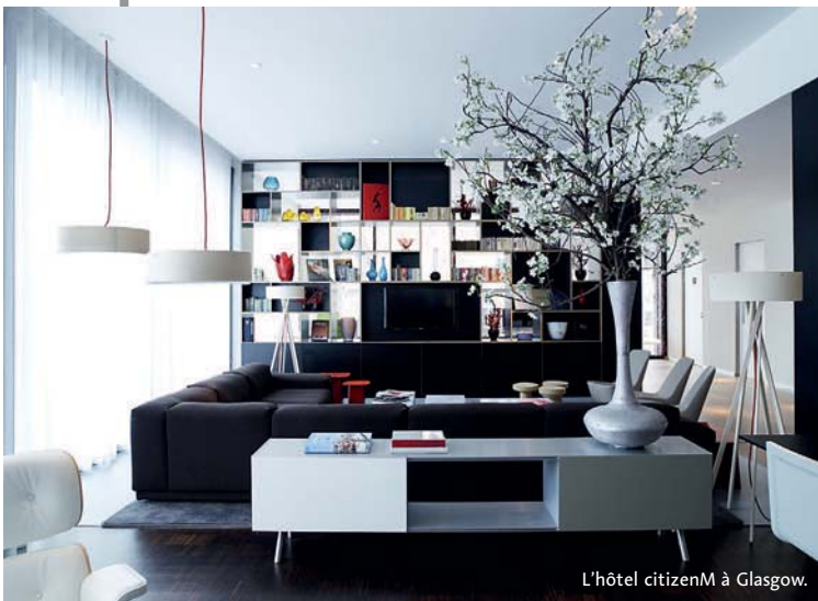
L'hôtel citizenM à Glasgow.