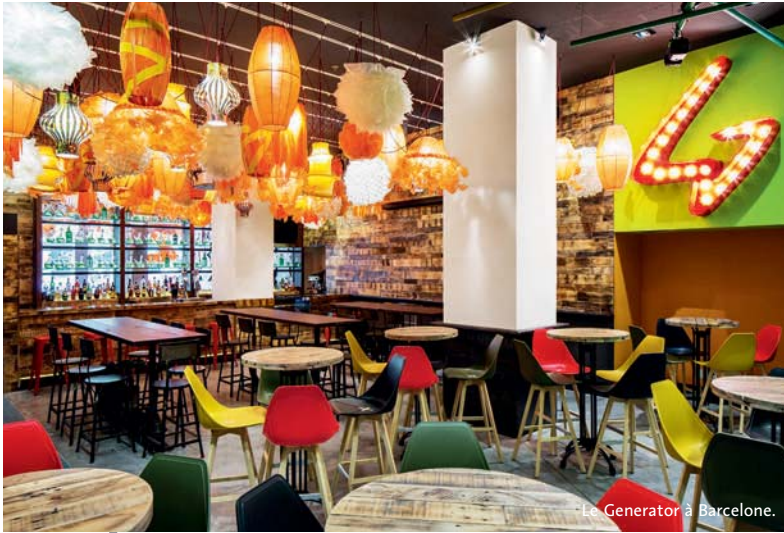
Le Generator à Barcelone.